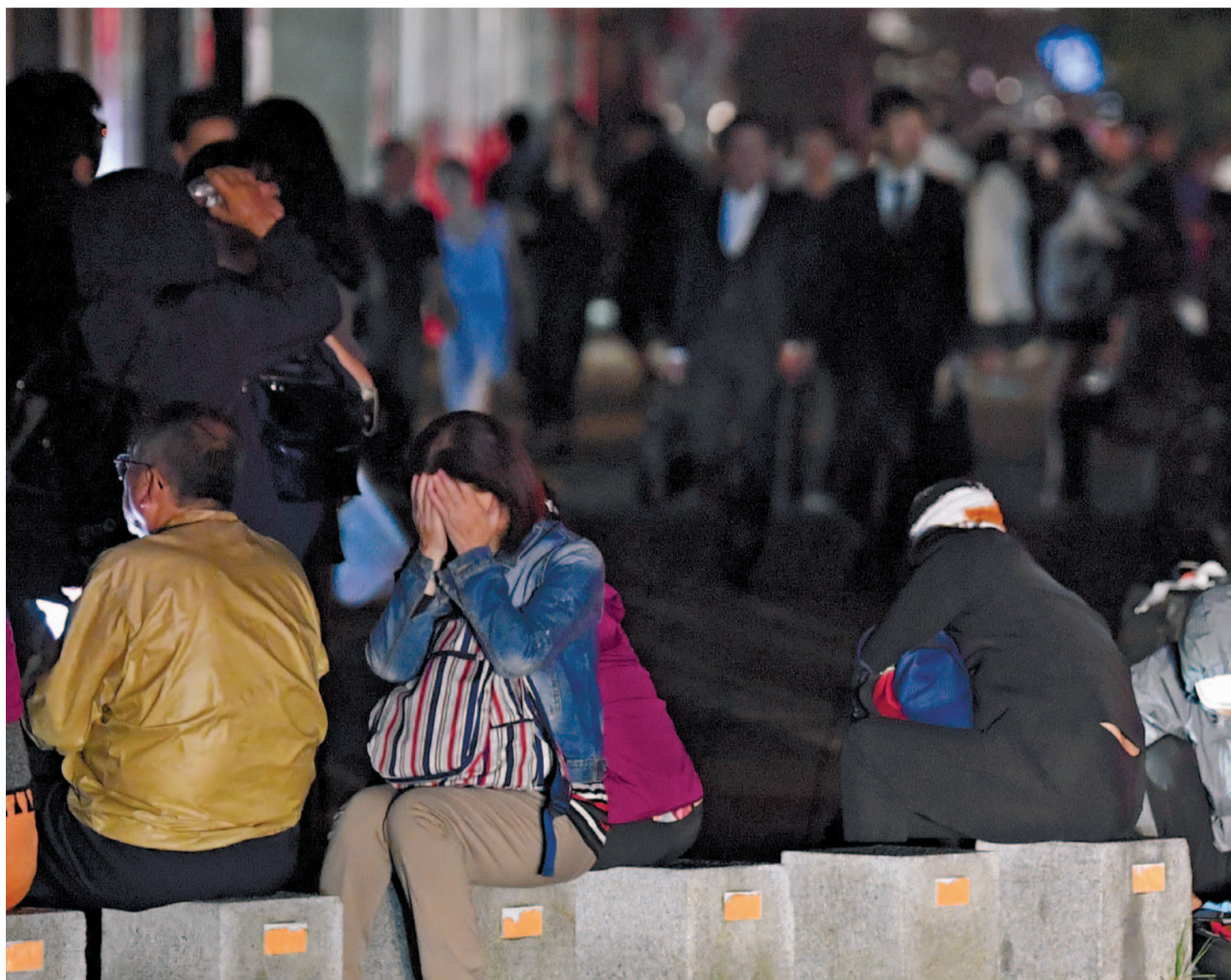
地震後、停電となり道端に座り込んで顔を覆う女性＝6日午前3時43分、札幌市中央区